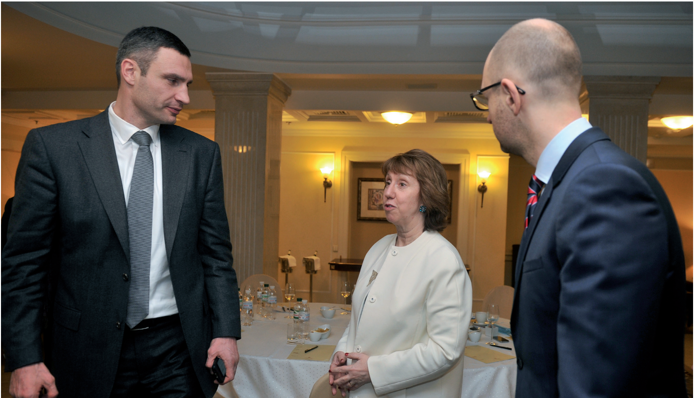
Die EU-Außenbeauftragte Catherine Ashton mit den (damaligen) ukrainischen Oppositionellen Witali Klitschko (Udar) und Arseniy Yatsenyuk (Batkiwschtschina).