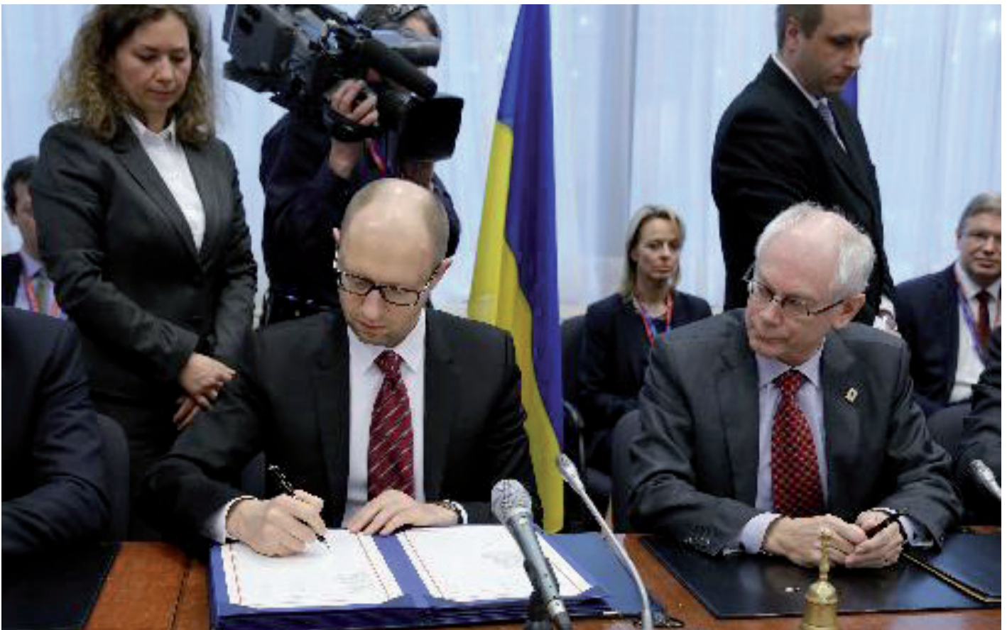
Unterzeichnung des Assoziationsabkommens zwischen der Ukraine und der EU Ende März 2014.