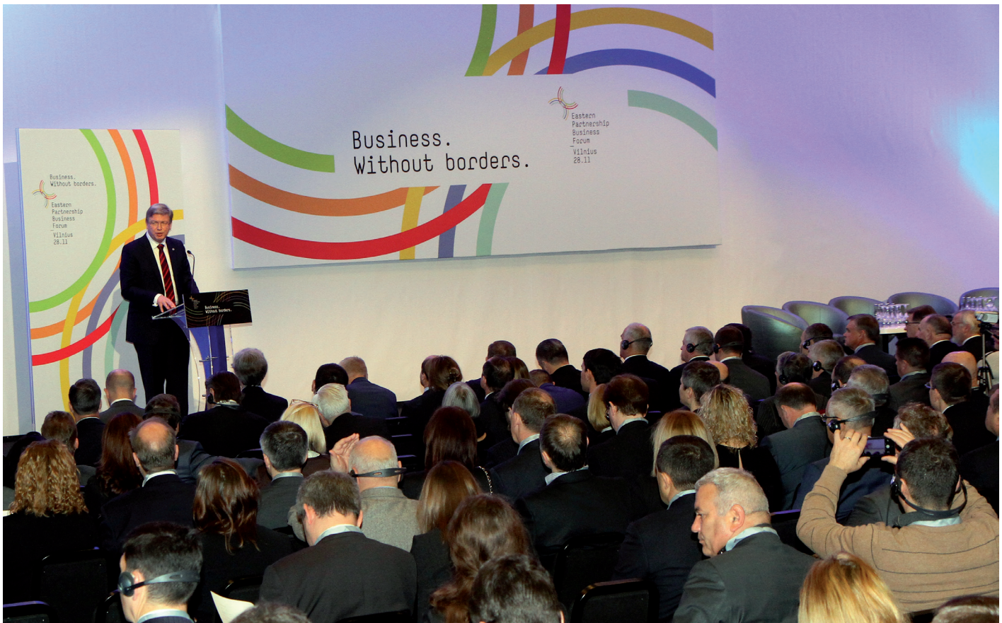
EU-Erweiterungskommissar Štefan Füle beim Gipfeltreffen der Östlichen Partnerschaft Ende November 2013.