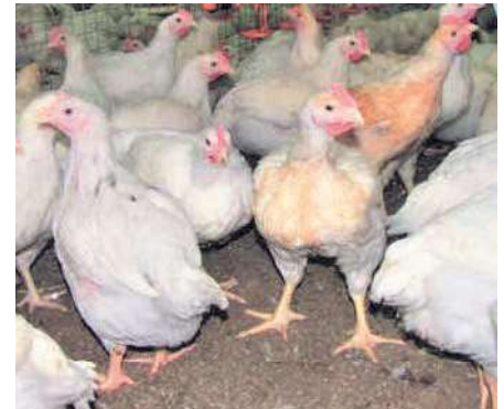
Abbildung 2: Ranger Classic am 42. Masttag.