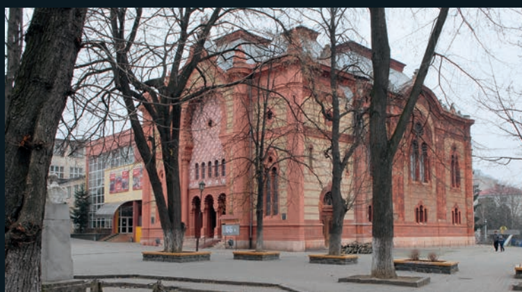
Vor dem Zweiten Weltkrieg: Eine prächtige Synagoge, im Zentrum von Ushgorod...

hier als in anderen Regionen der Ukraine.“ Die Frau des Rabbinen doppelt nach: „Natürlich kommt es vor, dass irgend ein Betrunkener auf der Straße blöde Sprüche gegen uns fallen lässt. Aber das gibt es auf der ganzen Welt. Damit kann man gut leben. Uns ist wohl hier.“ „Nein, die Juden wandern nicht aus wegen Antisemitismus, sie sind hier akzeptiert. Sie wandern aus wegen der wirtschaftlichen Situation hier. Es ist sehr schwierig, hier Arbeit zu finden“, sagt der Rabbi besorgt. ✨