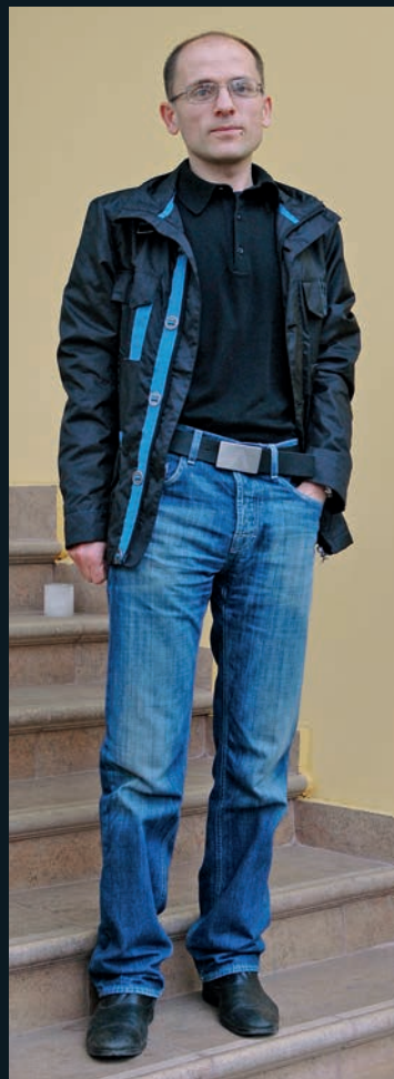
In Bluejeans, locker, aber blitz- gescheit

Und Geschichte, sein Studium, sein Hobby? Ja, er erklärt uns in allen Einzelheiten, wie es dazu kam, dass die Griechisch-Katholische Kirche der in Transkarpatien ansässigen Ruthenen zwar dem Papst in Rom unterstellt ist, im Ritus und auch in der Jurisdiktion aber den orthodoxen Kirchen näher steht. „Es war gegen Ende des 30-jährigen Krieges, als Österreich-Ungarn seine östlichen Gebiete nur ungern unter dem kirchlichen Einfluss des orthodoxen Patriarchen von Moskau sah. Deshalb wurde im Jahr 1646, wie schon 1594 wei-