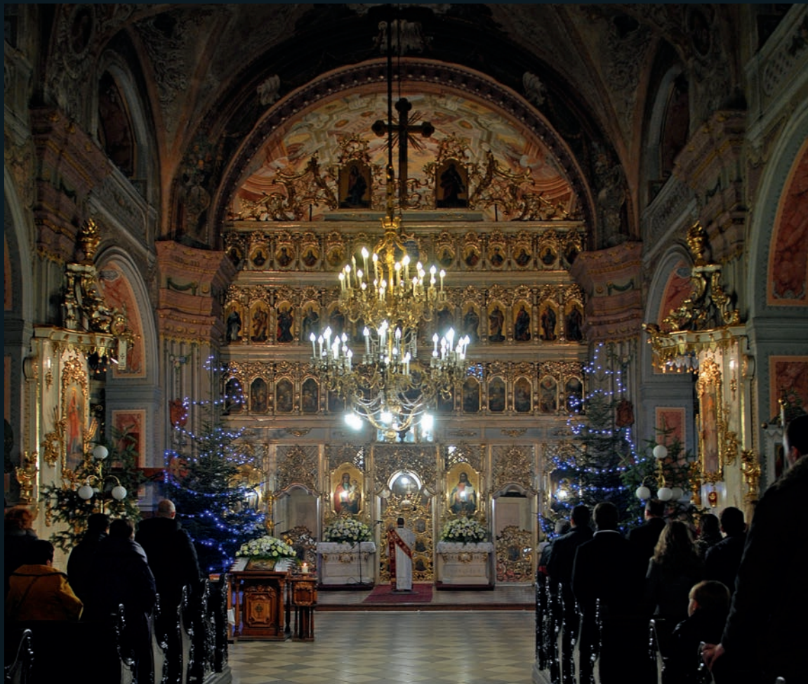
Weihnachtsmesse 2014 in der Kreuzerhöhungskathedrale in Ushgorod. 1646 von den Jesuiten erbaut, 1773 der Griechisch-Katholischen Kirche übergeben, in der Sowjetzeit eine orthodoxe Kirche, jetzt wieder eine Griechisch-katholische Kathedrale.