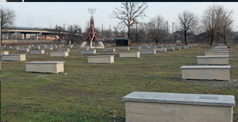
... und heute nur noch die Erinnerung: Holocaust-Monument in Mukachevo, unweit Ushgorod.