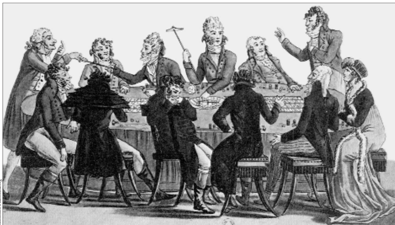
Das nicht berechnete Wirtschaftsgeschehen (elf Männer und eine Frau beim Roulette, ca. 1800)

WENN DER ABBAU VON RESSOURCEN ALS HÖHERER REICHTUM GILT, DANN LEBEN WIR AUF KOSTEN DER ZUKUNFT