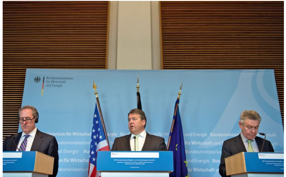
Bundeswirtschaftsminister Sigmar Gabriel flankiert von US-Handelsvertreter Michael Froman (links) und EU-Handelskommissar Karel De Gucht (rechts) an der Pressekonferenz zum TTIP-Dialog am 5. Mai 2014.

Die gegenwärtigen Bemühungen für ein umfassendes Handels- und Investitionsschutzabkommen zwischen der EU und den USA werden nicht ohne Auswirkungen auf die Schweiz bleiben. Eine Studie des World Trade Institute der Universität Bern im Auftrag des Staatssekretariats für Wirtschaft analysiert die möglichen Auswirkungen eines Abkommens auf die Schweizer Wirtschaft und auf die Handelsbeziehungen der Schweiz. Unterschiedliche Szenarien führen dabei zu unterschiedlichen Auswirkungen.